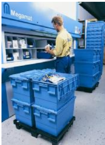
Integra v distribuci